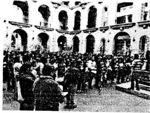
Escuela de Plan Sábado Chimaltenango 29-08-2013